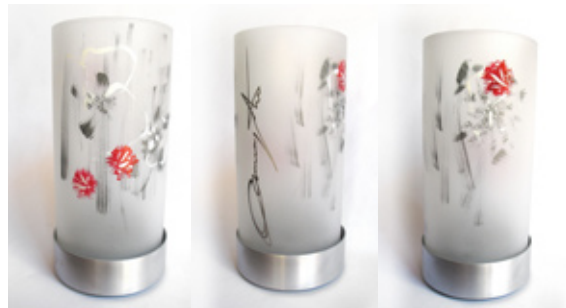
PHOTOPHORE haut 30cm