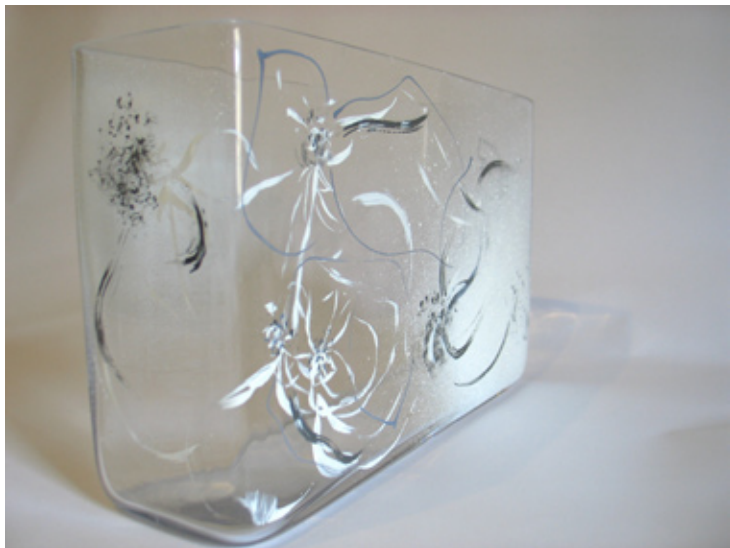
VASE haut 30cm