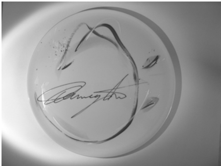
PLAT diam 30cm