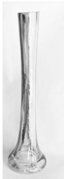
SOLIFLORE haut 20cm